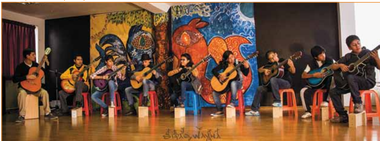
Workshopschluss bei Sipas Wayna

Im letzten Jahr hat apia Sipas Wayna mit CHF 25'000 unterstützt. Der bestehende Unterstützungsvertrag mit apia wird noch einmal um ein Jahr verlängert.